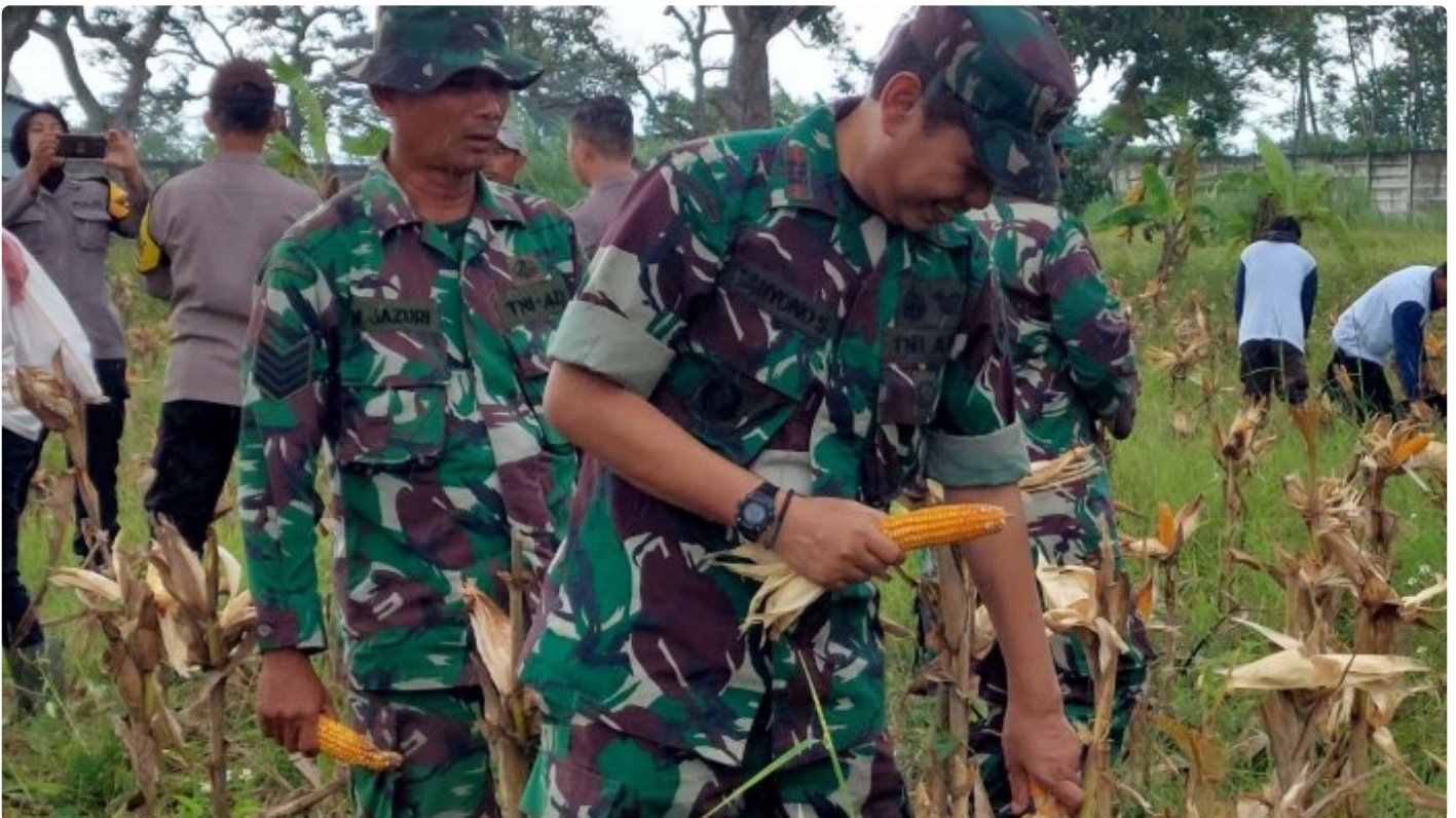
Wujudkan Ketahanan Pangan Bersama TNI AD, Lapas Terbuka Kendal Panen Jagung Bersama

KENDAL – Sinergi dengan TNI AD dalam hal ini Koramil 02/Patebon, Lapas Terbuka Kendal wujudkan program ketahanan pangan dengan melaksanakan budidaya jagung pada lahan seluas 3500m 2 . Bentuk keberhasilan dalam program ini, Lapas Terbuka Kendal bersama jajaran Koramil 02/Patebon panen jagung bersama pada Rabu (22/02/2023).